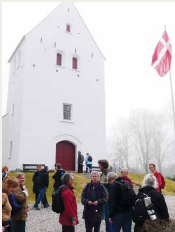
Pilgrimsvandring, Gurre Kirke