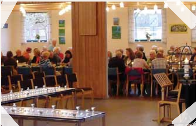
Påsken blev i Bellahøj kirke indledt med fælles nadvermåltid.