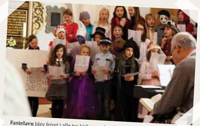
Fastelavn blev fejret i alle tre kirker med gudstjeneste, udklædning og efterfølgende tøndeslagning.